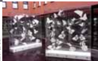
Cubes 2 400 x 2 400 mm - Maison de convalescence - Neuville-sur-Saône

lauréat, ce qui m'a permis d'obtenir la prime la plus haute et un prêt à taux zéro ». Dans l'atelier de la miroiterie des Plaines, 300 000 € d'équipement ont été ainsi investis : un centre d'usinage de 3 000 x 1 600 mm permettant de sortir de grandes pièces - pour lesquelles les architectes restent particulièrement demandeurs - une table de coupe float (Intermac), une rectiligne, une laveuse et une perceuse, avec en vue une prochaine table feuilletée de chez Bottero. « A l'exception de la trempe à façon, tout le process est géré en interne » précise Didier Cellier ; « nous avons déjà un très bon accueil de clients qui m'ont suivi et jouent le jeu. Je n'ai pas eu à lancer de véritables démarches commerciales pour l'instant, puisque la bouche à oreille a bien fonctionné ». Agenceurs, architectes, décorateurs, serruriers, ... la qualité et la complexité de certaines réalisations valent déjà une belle réputation à ce jeune quadragénaire, adhérent à la FFPV.